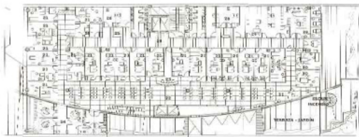
CONSULTORIOS EXTERNOS Y LOCALES DE PRÁCTICAS DIAGNÓSTICAS